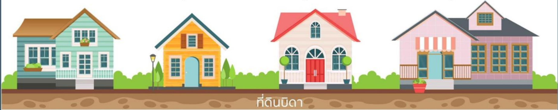
บ้านบุตรคนที่ 3

การแบ่งฐานภาษีในการคำนวณ กรณีปลูกบ้านในที่ดินของบิดา