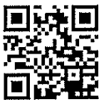
(ศูนย์บริหารสถานการณ์โควิด - ๑๙)