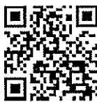
(กรมควบคุมโรค กระทรวงสาธารณสุข)