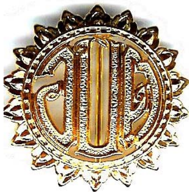
องค์การบริหารส่วนตำบล