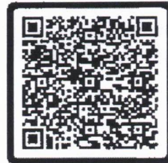
ข้อมูลการฝึกอบรม