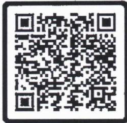
แบบตอบรับการลงทะเบียนล่วงหน้า

กองกำกับและขับเคลื่อนการดำเนินงานนโยบายภาครัฐ โทร. ๐ ๒๕๐๒ ๖๖๗๐ - ๘๐ ต่อ ๔๒๓๐