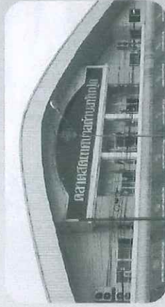
มีโครงสร้าง จำนวน 3,081 แห่ง

ยอดรวมตลาดในพื้นที่ 8,029 แห่ง แบ่งเป็น ดังนี้ ตลาด อปท. จำนวน 1,401 แห่ง ตลาดเอกชนและอื่น ๆ จำนวน 6,628 แห่ง ตัวชี้วัดเป้าหมาย ร้อยละ 70