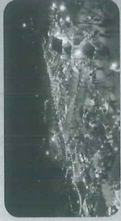
ไม่มีโครงสร้าง จำนวน 4,948 แห่ง