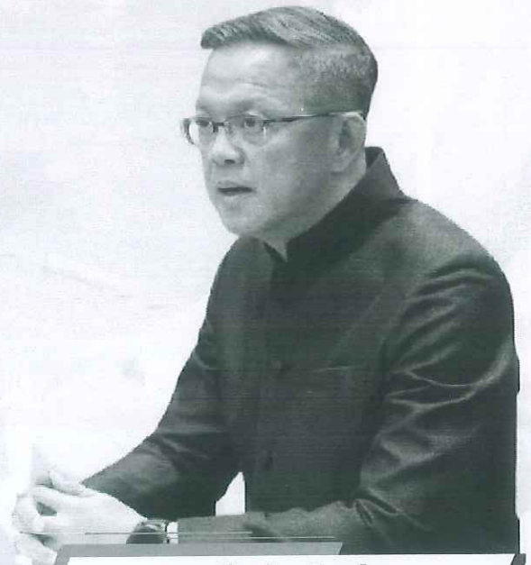
นายธีรุตม์ ศุภวิบูลย์ผล อธิบดีกรมส่งเสริมการปกครองท้องถิ่น

กองสาธารณสุขและสิ่งแวดล้อมท้องถิ่น กรมส่งเสริมการปกครองท้องถิ่น