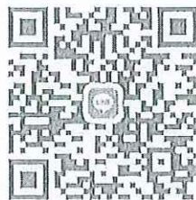
กลุ่ม Line One Health เขต 9