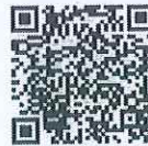
การทดสอบวัดสมรรถนะ ทางด้าน การวัดและประเมินผลการเรียนรู้