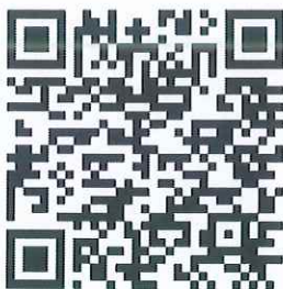
QR Code สำหรับตรวจสอบจำนวนผู้ชำระเงินค่าลงทะเบียนในแต่ละรุ่น