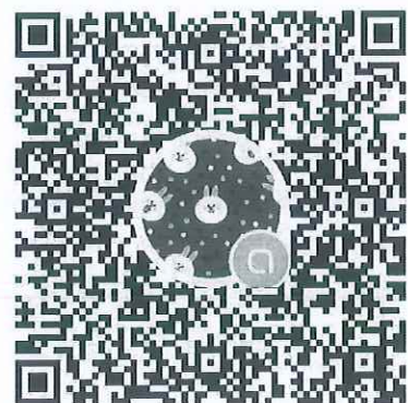
เข้าร่วมกลุ่มไลน์ (Open chat)