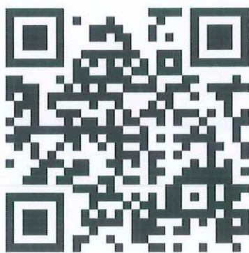
แบบตอบรับ (รูปแบบ Online)