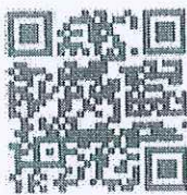
(QR Code สำหรับรายงานแผนฯ)

หมายเหตุ : ขอความร่วมมือทุกจังหวัด กรอกข้อมูลแผนการรณรงค์ประชาสัมพันธ์ในพื้นที่ผ่านระบบออนไลน์ (ตาม QR Code) ภายในวันศุกร์ที่ ๒๙ พฤษภาคม ๒๕๖๙ เพื่อเป็นข้อมูลสำหรับประชาสัมพันธ์ผ่านสื่อมวลชนในภาพรวมของประเทศต่อไป