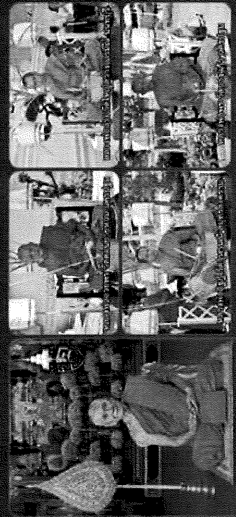
พระกริ่งพระพุทธรูปปางนาคปรก

พระกริ่งพระพุทธรูปปางนาคปรก (Naga Mukha) เป็นพระพุทธรูปปางที่พระศาสดาได้แสดงธรรมแก่ชาวเมืองสาวัตถี โดยทรงประทับนั่งบนบัลลังก์ 2 องค์ ทรงวางพระบาทขวาบนบัลลังก์เบื้องขวา และพระบาทซ้ายบนบัลลังก์เบื้องซ้าย พระเศียรทรงแสดงพระเมตตาอันเป็นนิมิตต์แห่งธรรมแก่ชาวเมืองสาวัตถี ซึ่งได้ทูลถามพระศาสดาว่า พระศาสดาจักเสด็จไปสู่นครใด พระศาสดาจึงทรงตอบว่า พระศาสดาจักเสด็จไปสู่นครสาวัตถี พระศาสดาจึงทรงประกาศธรรมแก่ชาวเมืองสาวัตถี โดยทรงประกาศธรรมแก่ชาวเมืองสาวัตถี โดยทรงประกาศธรรมแก่ชาวเมืองสาวัตถี โดยทรงประกาศธรรมแก่ชาวเมืองสาวัตถี