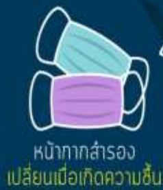
หน้ากากสำรอง เปลี่ยนเมื่อเกิดความชื้น