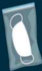
ถุงซิปล็อค ใช้เก็บหน้ากากที่ใช้แล้ว