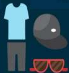
ของใช้ส่วนตัวต่างๆ