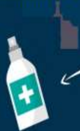
เจล/สเปรย์ แอลกอฮอล์