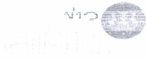
วิทยุกระจายเสียงแห่งประเทศไทย