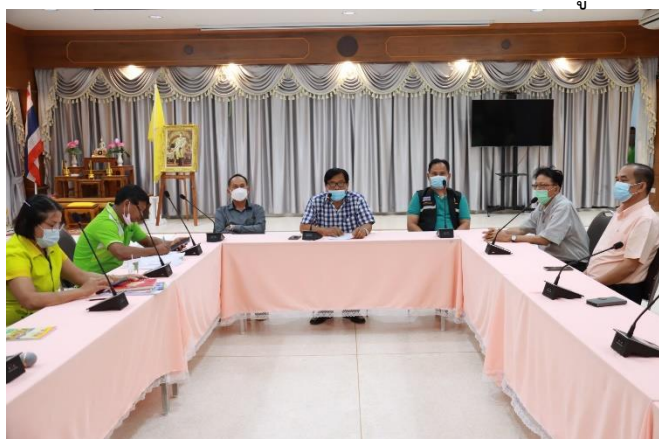
รูปภาพประกอบ