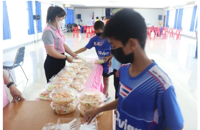
ช่วงพักรับประทานอาหารกลางวัน