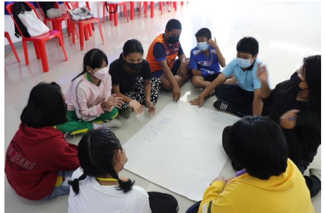
การทำกิจกรรมกลุ่มเพื่อร่วมกันหาปัญหาที่เกิดกับเด็กและเยาวชนและแนวทางแก้ไขปัญหา