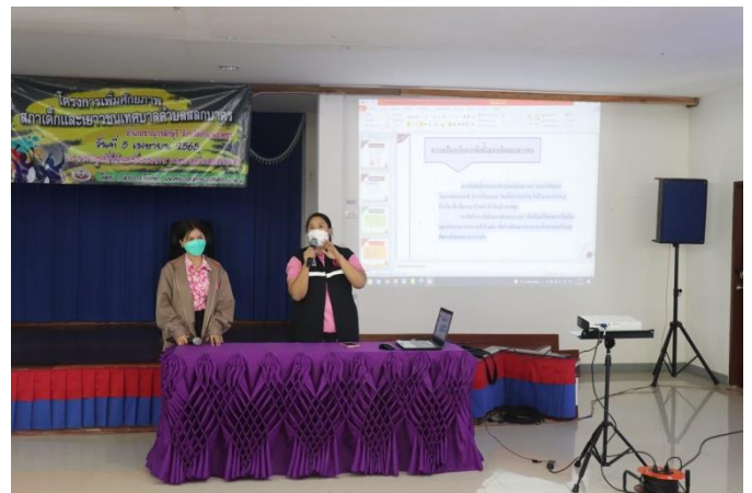
ภาคบ่าย เป็นการให้ความรู้เรื่องความเป็นมาของสภาเด็กและเยาวชน รวมถึงบทบาทและหน้าที่ของ สภาเด็กและเยาวชน โดยเจ้าหน้าที่จากบ้านพักเด็กและครอบครัวจังหวัดกำแพงเพชร ให้เกียรติเป็นวิทยากร