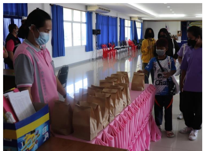
ช่วงพักรับประทานอาหารว่างในภาคบ่าย