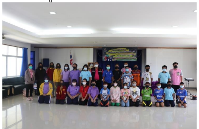
ในช่วงสุดท้ายคณะวิทยากรได้สรุปผลการทำกิจกรรมและให้ข้อเสนอแนะแก่ผู้เข้าร่วมโครงการ